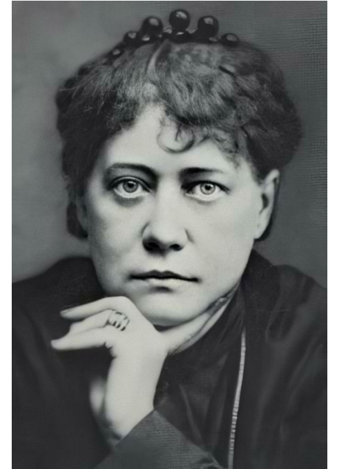
Abb. 1: Helena P. Blavatsky

Einflussreiche Publikationen : 1877 „Isis entschleiert“ und 1888 „The Secret Doctrine“